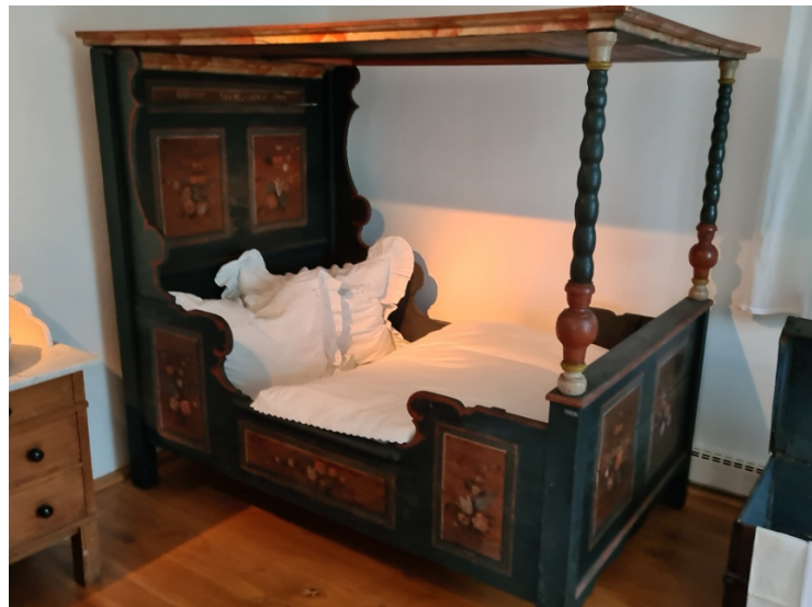
Het fris opgemaakte bed van Wagner