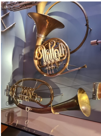
Een Wagnertuba en een klassieke hoorn

Uitvoerige informatie is te vinden op https://www.wagnerstaetten.de .