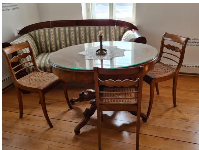
Beeld van de zitkamer