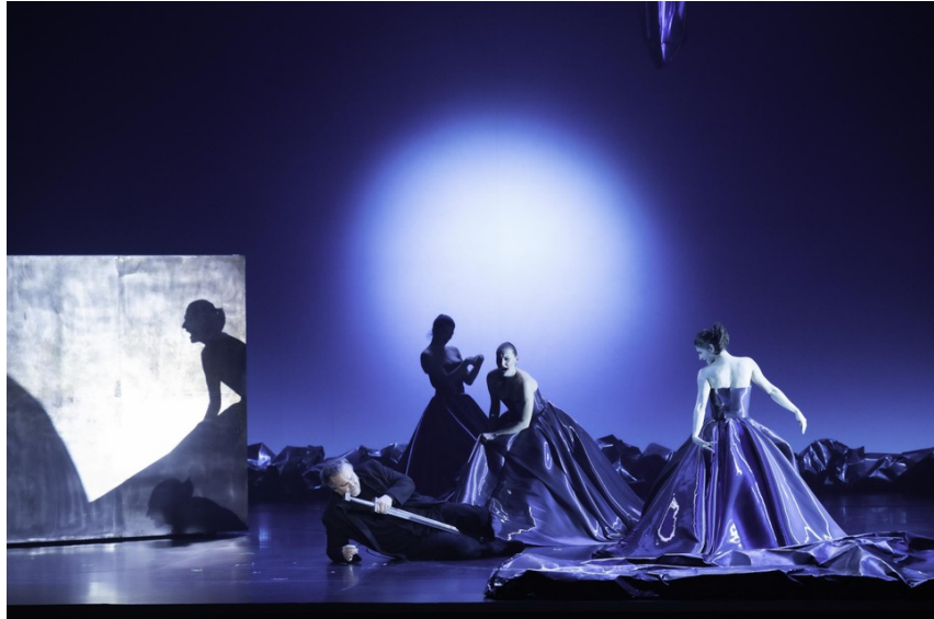
Siegfried met de Rijndochters

Een speciale vermelding verdient het lichtplan van Valerio Tiberi. In samenwerking met de regie worden prachtig effecten op het podium creëert van bijvoorbeeld zangers die zo worden uitgelicht dat hun schaduw, groot of klein, op een van de decorstukken valt. Dergelijke visuele effecten dragen bij aan de zeggingskracht net zoals het gebruik van halflicht om de duistere kant van de Tarnhelm te versterken. Het is allemaal zeer mooi gedaan.