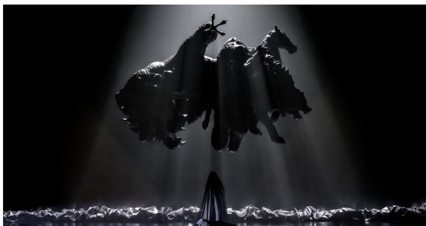
Götterdämmerung , De Munt, Brussel

De decorstukken bestaan uit blokken cortenstaal die handig over het toneel worden bewogen. Verder is er een enorme zwarte sculptuur met verschillende in elkaar vervlochten dieren die boven het toneel hangt. Het paard Grane, een drakenkop en ongetwijfeld nog een paar kraaien maken er deel van uit. Verder staan er wanneer ze voor het verhaal nodig zijn, aan de zijkant van het toneel een speer en aan de andere kant het reliëf van de wereld-es.