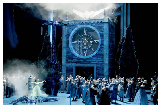
Scene beeld Lohengrin (Bayreuther Festspiele 2018)