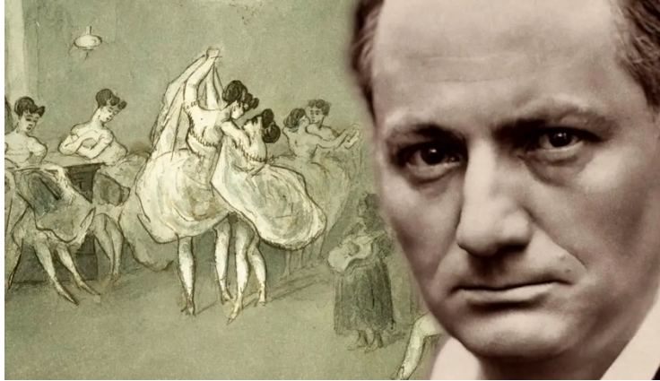
Schopenhauer - Kunst als tegengif tegen het lijden

Wagner is onder de indruk van Schopenhauer en de gedachten over de onthechting ten opzichte van het dagelijks leven. Hij leest Schopenhauers 'Die Welt als Wille und Vorstellung' in 1854 (gepubliceerd in 1818) en doet dat niet één maar vier keer. Hij twijfelt of hij contact zal zoeken met Schopenhauer om met hem verder te filosoferen maar durft dat niet aan. Met Schopenhauer begint Wagner eigenlijk pas goed zijn filosofische kant te ontwikkelen. We hebben al gezien dat hij daarvoor toch meer de