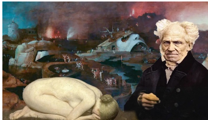
Baudelaire – diepe waardering voor kunst als het verkennen van bijzondere schoonheid

Wagner wil heel graag doorbreken in Parijs en keert in 1859 terug naar de Franse hoofdstad. Hij is vastbesloten om daar Tannhäuser op te voeren en gaat daarin zover dat hij er aanzienlijke aanpassingen voor wil doen. Er komt een Franse tekst en wat kleine aanpassingen in de muziek om tekst en muziek weer op elkaar aan te laten sluiten. Wagner dirigeert zo'n honderd repetities, maar het komt in 1861 uiteindelijk maar tot een handjevol voorstellingen. De Franse theaterelite vindt dat er te weinig ballet in zit en organiseert boe-geroep